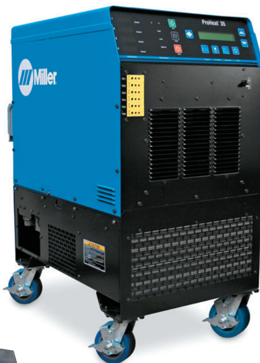
ProHeat 35 toiteallikas (907690), pildil koos suure võimsusega induktsioonjahutiga (301298) ja lisaveermikuga (195436).