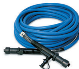
ProHeat vedelikuga jahutatav induktsioonkuumutuskabel.

Keetmise käigus luuakse parem töökeskkond . Kevitajatele ei teki avatud tulest, lõhkegaasist ja kuumaks läinud elementidest ohtu, mida seostatakse gaasikütuse ja takistuse abil kuumutamise.